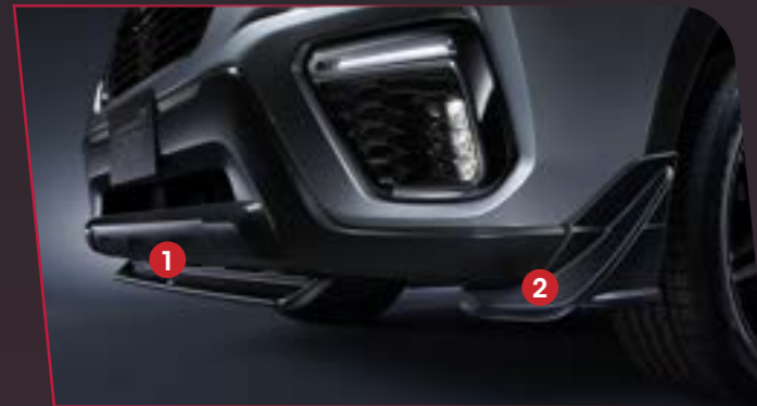
1 ỐP HƯỚNG GIÓ DƯỚI CẢN TRƯỚC 12.000.000 VND ST96020SE010

Đem đến sự ổn định cho thân xe và giúp bạn thoải mái hơn khi lái xe.