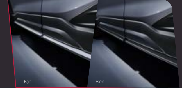
ỐP HƯỚNG GIÓ DƯỚI BÊN CỬA 19.000.000 VND ST96030SE000

Giúp định hướng luồng gió từ trước ra sau xe bằng cách hướng gió về phía cuối xe. Đồng thời triệt tiêu các luồng khí nhiễu loạn xung quanh cản sau, nhằm tăng cường sự ổn định khi vận hành và cải thiện sự êm ái cho hành khách trên xe.