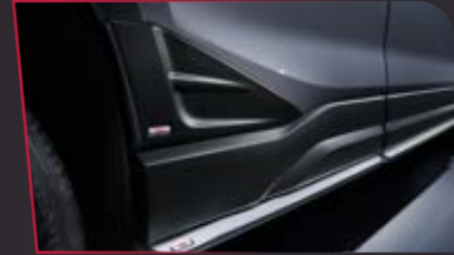
ỐP HƯỚNG GIÓ PHÍA DƯỚI CỬA SAU 12.000.000 VND ST96030SE150

Giúp định hướng luồng gió dọc thân xe từ trước đến sau, nhằm nâng cao sự ổn định thân xe. Đồng thời tăng cường bảo vệ cho thân xe khỏi những hư hỏng không đáng có do bị sỏi đá hay các tác nhân nhỏ khác văng vào xe.