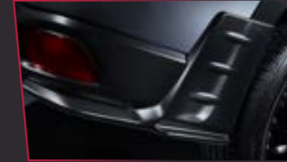
ỐP HƯỚNG GIÓ CẢN SAU 16.000.000 VND ST96031SE000

Giúp định hướng luồng gió dọc thân xe từ trước đến sau, nhằm nâng cao sự ổn định thân xe. Đồng thời tăng cường bảo vệ cho thân xe khỏi những hư hỏng không đáng có do bị sỏi đá hay các tác nhân nhỏ khác văng vào xe.