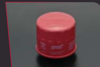
LỌC NHỚT 1.500.000 VND ST15208ST010

Lọc nhớt giúp sự trao đổi quá trình lọc tăng lên 15% so với tiêu chuẩn. Với chất liệu hiệu suất cao, lọc nhớt này giúp giữ lại nhiều carbon hơn, giảm 10% sự tiêu hao áp lực. Hoàn toàn phù hợp với các loại nhớt cao cấp, đồng thời đem lại hiệu suất cao và ổn định trong điều kiện vận hành bình thường hay trên những cung đường khắc nghiệt.