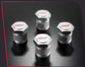
NẮP ĐẬY VAN VỎI BÁNH XE LOGO STI (Bộ 4 cái) 500.000 VND ST28102ST030A

Nắp chụp van vòi siêu nhẹ với thiết kế chống trượt độc đáo được gia công từ hợp kim nhôm. Bề mặt được phủ nhôm bạc bằng công nghệ hiện đại, gia tăng khả năng chống chọi với thời tiết và màu sắc thiết kế hài hòa với mâm xe. Đầu nắp chụp được chế tác bằng hình lục giác với logo STI dập nổi màu đỏ nổi bật.