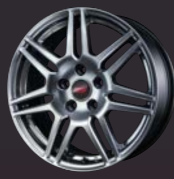
MÂM XE 17 INCH MÀU BẠC, XÁM ĐEN 19.000.000 VND B3110SJ100/110/120

Mâm đúc hợp kim nhôm được chế tác bởi công nghệ phay tiện ly tâm để tạo ra hình dáng đặc trưng. Giúp giảm trọng lượng cho mâm nhưng không làm giảm đi độ chịu lực. Thiết kế đặc biệt phù hợp cho dòng xe Forester về cả hình dáng và màu sơn.