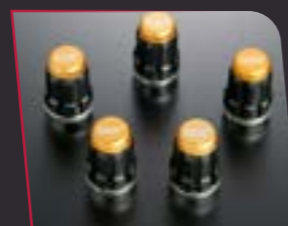
BỘ NÚM CHỤP BẢO VỆ ỐC BÁNH XE MÀU VÀNG 9.000.000 VND ST28170ST010

Bộ núm chụp ốc bánh xe với 3 kết cấu. Sản phẩm được mạ 3 lớp với bề mặt chống ăn mòn đặc biệt. Núm chụp chống trộm được thiết kế sắc sảo với logo STI khắc laser trên bề mặt. Chỉ có thể tháo lắp loại núm chụp này bằng dụng cụ chuyên dụng.