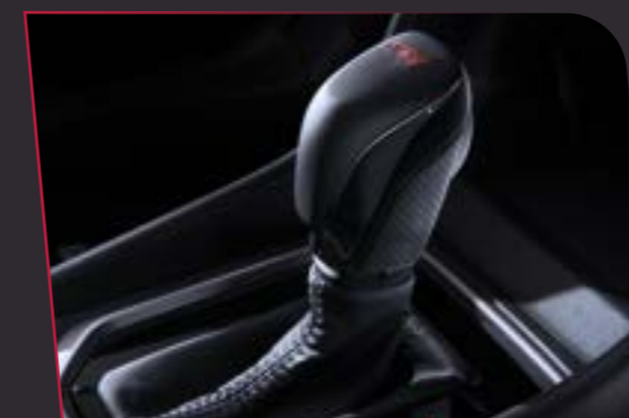
TAY NẮM CẦN SỐ STI 7.500.000 VND C1010S.000

Nút bấm khởi động dành riêng cho dòng xe sử dụng chìa khoá thông minh. Logo STI thiết kế trên nền màu đỏ tạo nét cá tính và thể thao cho nội thất của xe.