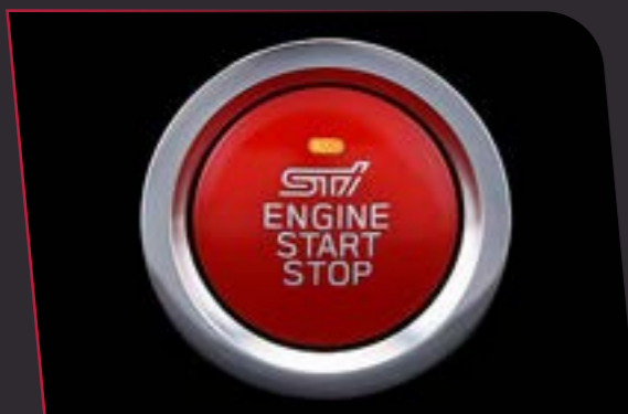
NÚT BẮM KHỞI ĐỘNG STI 1.200.000 VND ST83031ST050A

Nút bấm khởi động dành riêng cho dòng xe sử dụng chìa khoá thông minh. Logo STI thiết kế trên nền màu đỏ tạo nét cá tính và thể thao cho nội thất của xe.