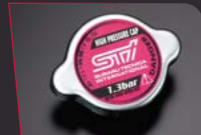
NẮP ĐẬY KẾT NƯỚC CHỊU ÁP SUẤT CAO CÓ LOGO STI 500.000 VND ST4511355010A

Ốp trang trí nắp trên lọc nhớt được chế tạo bằng phương thức đổ khuôn nhôm chắc chắn đi cùng với ốp nhựa cách điệu ở phía trên. Hình dáng của nắp được thiết kế đặc biệt dễ thao tác ngay cả khi sử dụng găng tay. Nắp nhôm bạc đi với nắp chụp nhựa logo STI được dập nổi trên nền màu đỏ mang đến cảm giác khác biệt cho khoang động cơ.