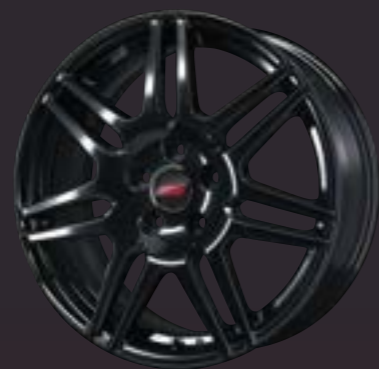
MÂM XE 18 INCH MÀU ĐEN 20.000.000 VND B3110SJ020