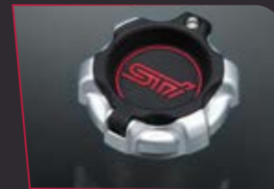
NẮP TRANG TRÍ HỢP KIM NHÔM LỘC NHỚT LOGO STI 3.200.000 VND ST15257ZR010

*Tương thích với các loại bình ắc quy kí tự thứ 3 trên chúng loại là "D"