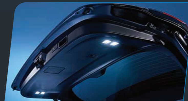
ĐÈN LED CỐP SAU 13.000.000 VND H4610SJ000

Tùy chỉnh nội thất Forester với bộ đèn chiếu sáng khoang hành lý ban đêm với ánh sáng đèn LED sắc xanh dịu nhẹ.