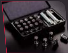
BỘ NÚM BẢO VỆ ỐC BÁNH XE LOGO STI 14.000.000 VND ST28170ST060

Nắp chụp van vòi siêu nhẹ với thiết kế chống trượt độc đáo được gia công từ hợp kim nhôm. Bề mặt được phủ nhôm bạc bằng công nghệ hiện đại, gia tăng khả năng chống chọi với thời tiết và màu sắc thiết kế hài hòa với mâm xe. Đầu nắp chụp được chế tác bằng hình lục giác với logo STI dập nổi màu đỏ nổi bật.