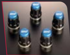
BỘ NÚM CHỤP BẢO VỆ ỐC BÁNH XE MÀU XANH 8.000.000 VND ST28170ST000