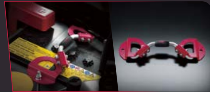
THANH KẸP BÌNH ẮC QUY STI 500.000 VND ST82182ST000A

Kẹp giữ bình ắc quy độc quyền giúp gợi nhớ đến thanh Strutbar đặc trưng của STI, gây sự thu hút mạnh mẽ cho khoang động cơ, không những thế, còn giúp bình ắc quy kích thước lớn được cố định một cách chắc chắn.