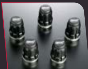
BỘ NÚM BẢO VỆ ỐC BÁNH XE MÀU ĐEN 8.000.000 VND ST28170ST020

Bộ sản phẩm gồm 16 taquet vận và 4 taquet khoá. Đảm bảo an toàn với cơ chế khoá tin cậy. Được mạ chrome và nickel 3 lớp chống rỉ sét. Đi kèm với bộ dụng cụ chuyên dụng từ McGuard. Kích thước 12 x 1.25mm