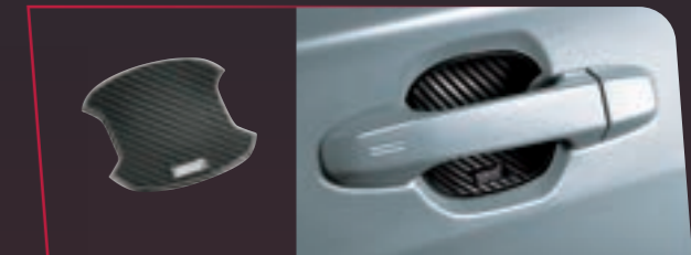
ỐP BẢO VỆ TAY NẮM CỬA (Bộ 4 cái) 2.000.000 VND ST91099ST080

Ốp bảo vệ tay nắm cửa có vân carbon giúp tránh trầy xước và dấu vân tay để lại khi đóng mở cửa xe. Được thiết kế dành riêng cho tay nắm cửa theo xe, ngoài tính năng bảo vệ cho hõm tay nắm, còn làm cho vẻ bề ngoài xe trông cá tính và thể thao hơn.