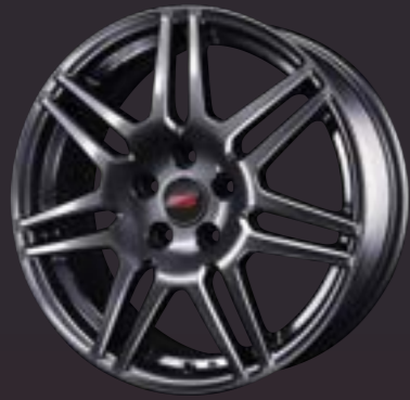
MÂM XE 18 INCH MÀU BẠC 20.000.000 VND B3110SJ000