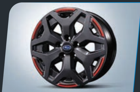
DECAL MÂM XE 6.000.000 VND J1210SJ000

Với họa tiết mang sắc màu cá tính. Decal mâm xe được thiết kế riêng cho dòng Forester giúp tôn lên dáng vẻ thể thao vốn có của xe.